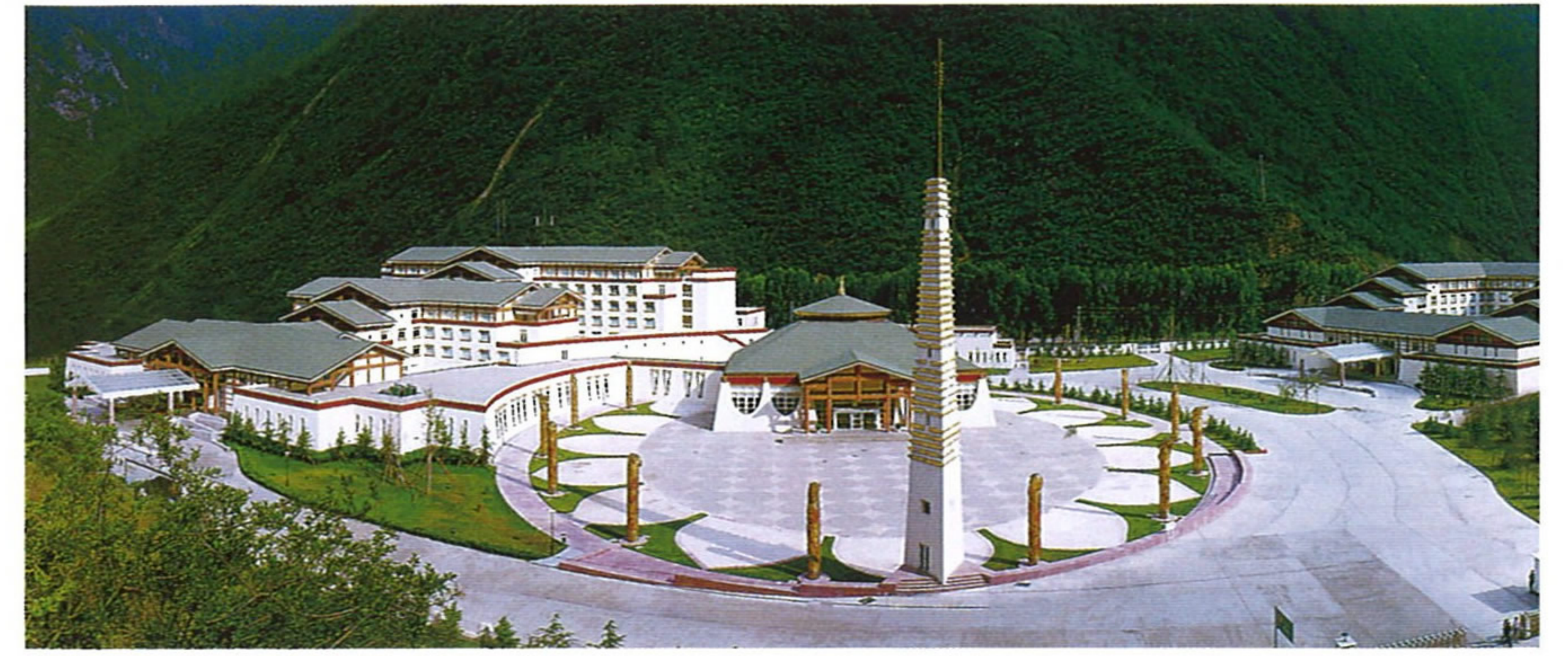
九寨溝国際大酒店