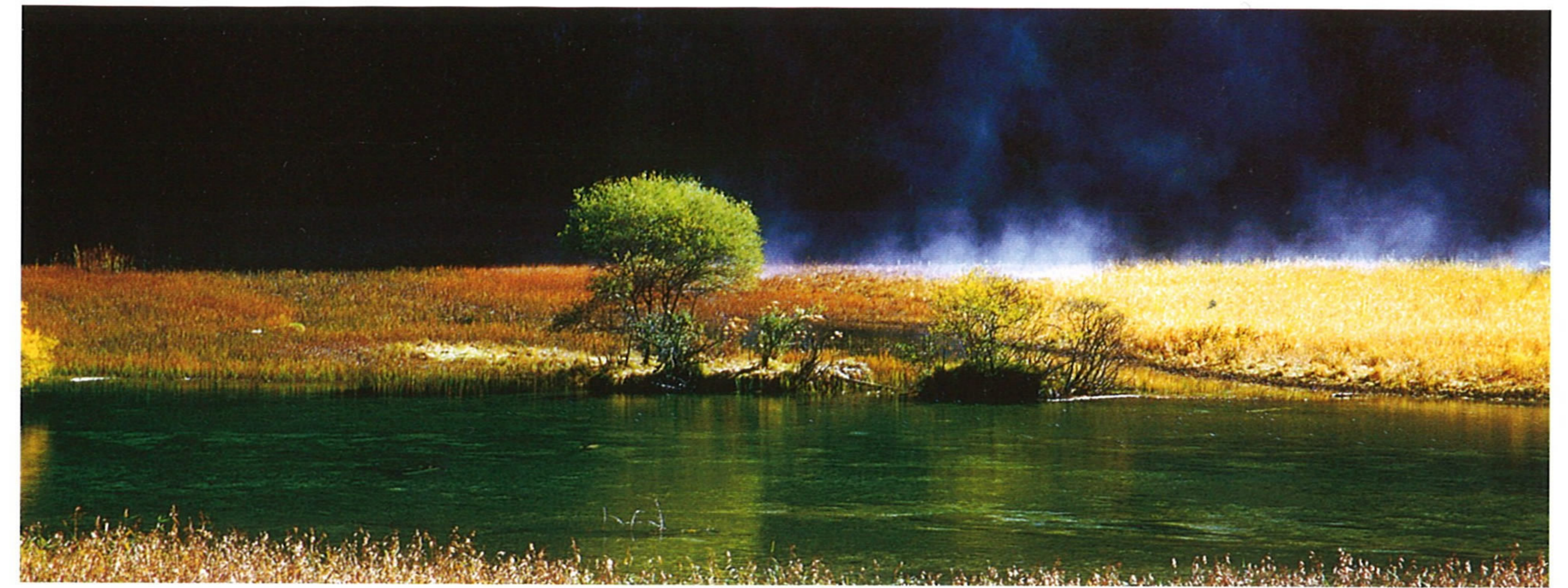
景色雄大な芦葦海

滝。浅黄色のトラパーチンの灘を流れている清い水は、大小様々な「生物的カルスト地形」の灘に、数え切れないほどの水玉をしぶき、陽射に照らされると真珠のようにピカピカと煌く。落差28m、幅310mの珍珠灘瀑布は新月の形を呈している。広々とした滝は真珠灘から勢いよく飛びこみ、環状の水スクリーンを広げている。滝は轟くように響きながら淵に落とし、しぶきを激しく飛ばしている。雄大な氣勢を見せている。