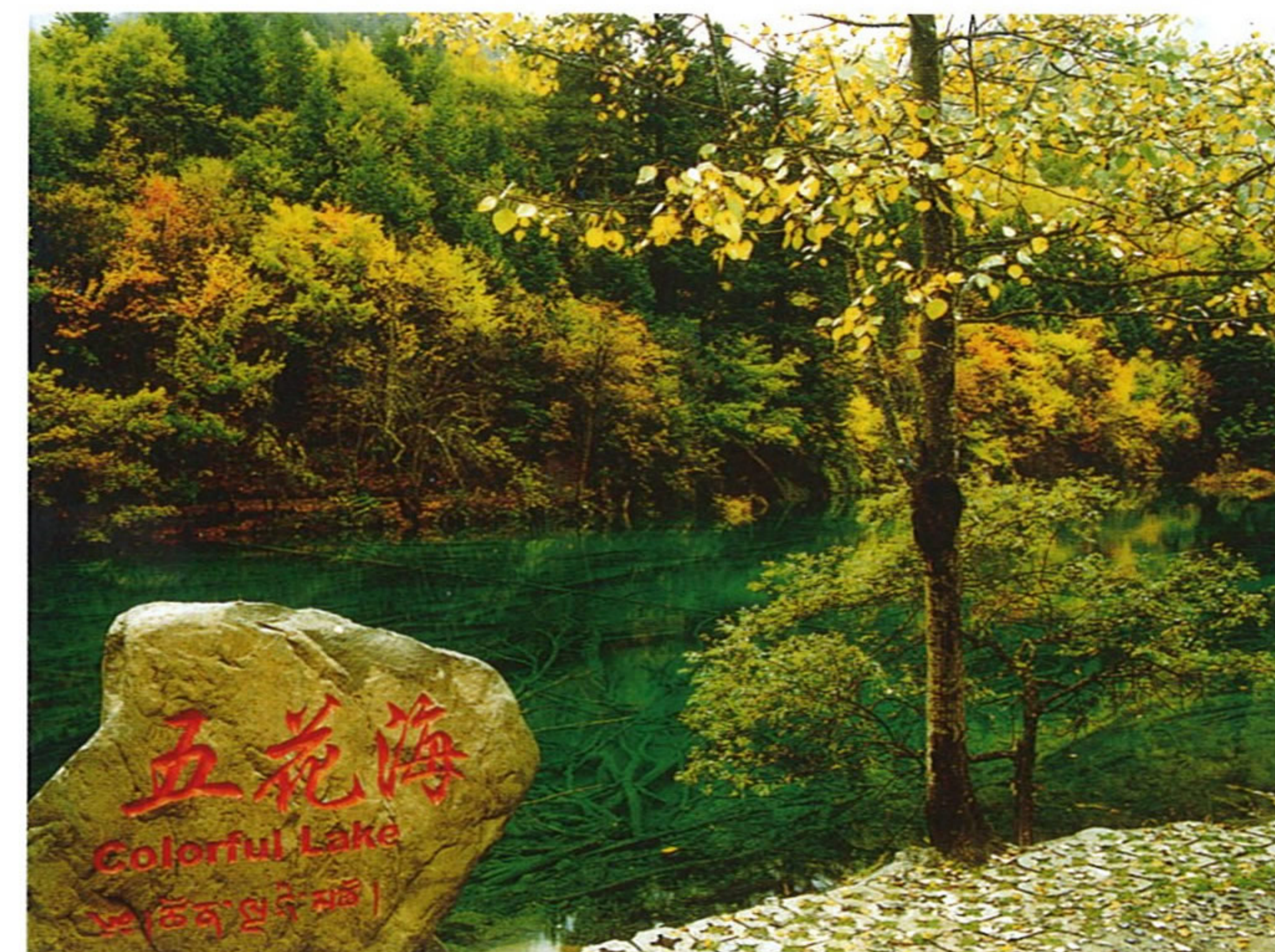
カラフルな五花海