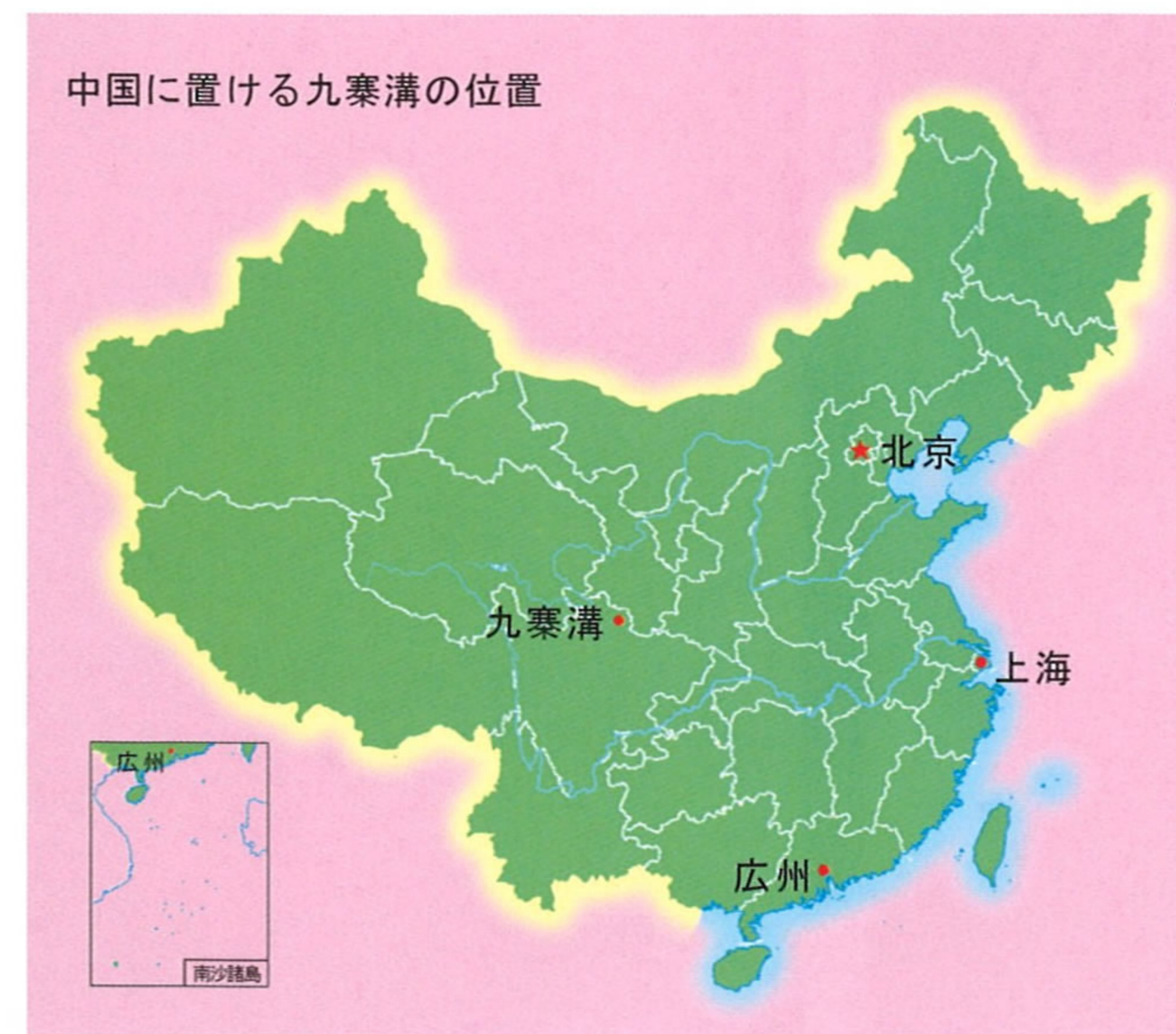
中国に置ける九寨溝の位置

区内交通: 九寨溝観光区内には、便利なエコロジーのバッテリーカーが運行し、指定される停留所で乗り降りできる。乗車券は、入場券と共に買える。乗車料はオンシーズン(5月1日~10月)に90元、オフシーズンに70元、保険料は3元。