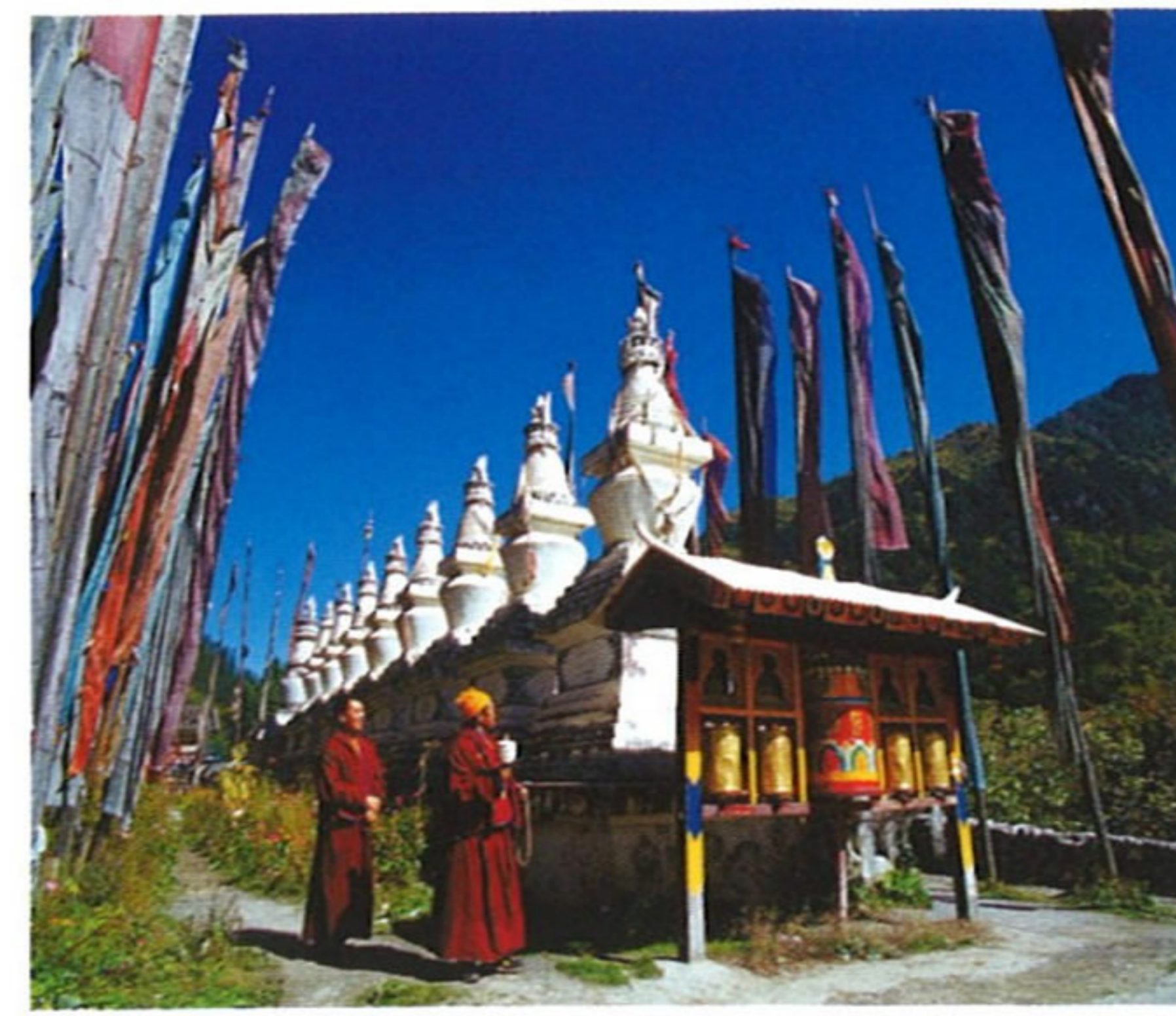
チベット族の祭風景