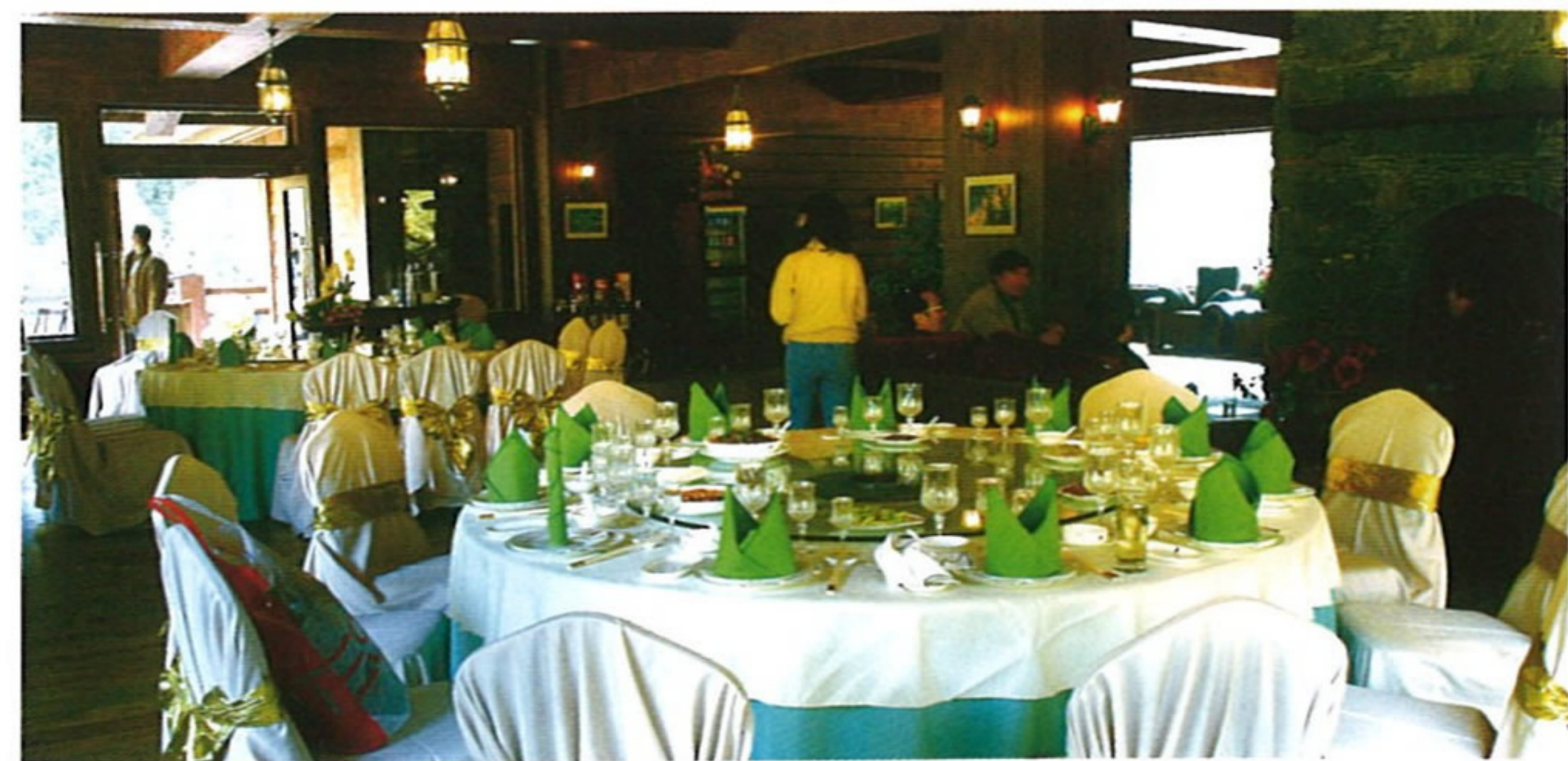
天堂度假中心レストラン

九寨溝の各ホテルは、観光客に正真正銘の四川料理、広東料理、安徽料理、西洋料理、地元のチベット料理を提供している。施設が整備されるレストランは、観光客の憩いの場。あるホテルは、九寨溝観光の特徴に応じて、持ち替えの食品も用意している。観光客は、観光しながら美食を堪能。