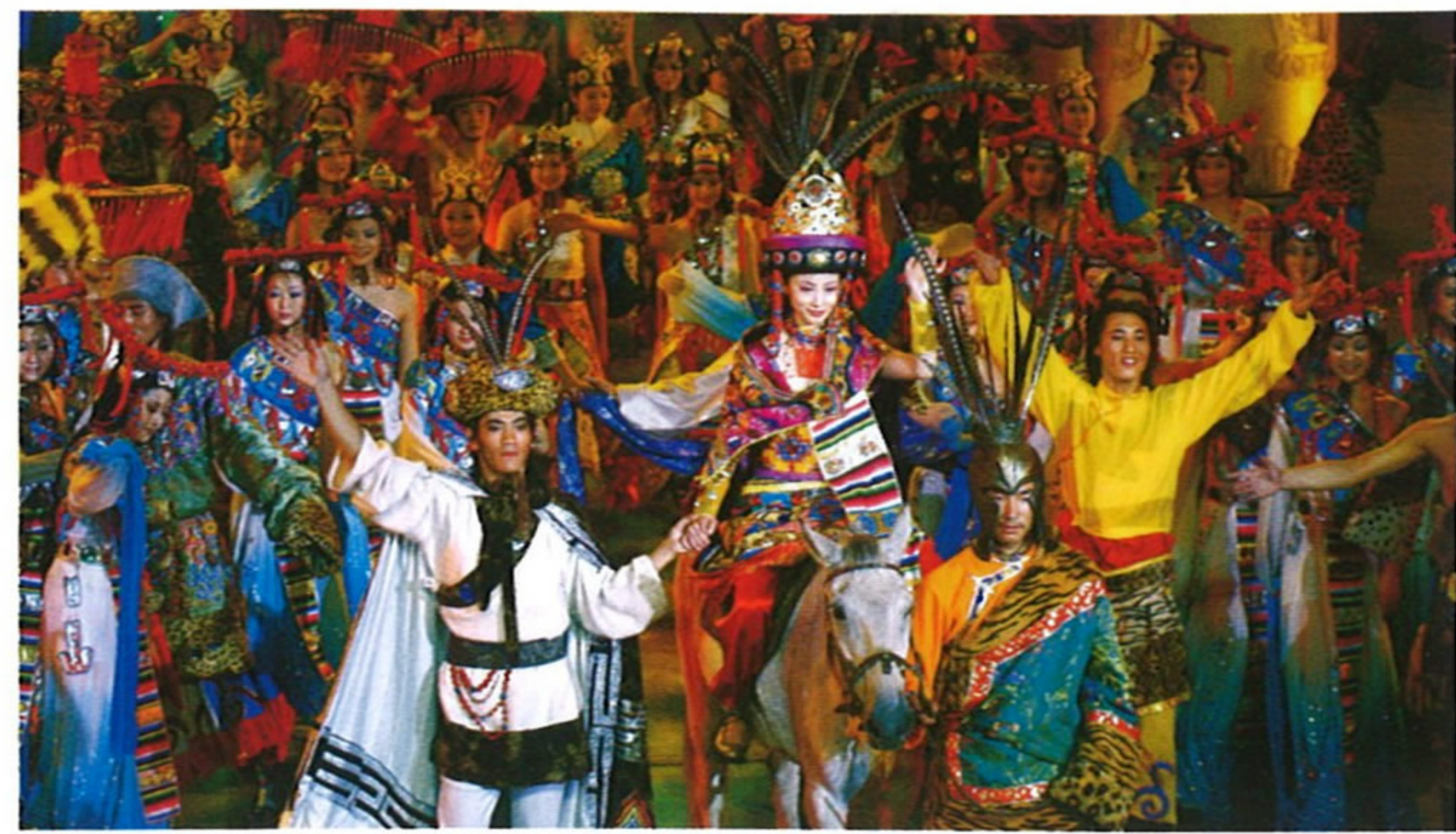
天堂大劇院のチベット族のミュージカル

属は熱帯に、342属は温帯に、16属は汎地中海に分布し、15属は中国特有の植物で、藻類は6門、32科、74属、312種あり、うち中国の関係文献には記されないものが43種(変種を含む)ある。